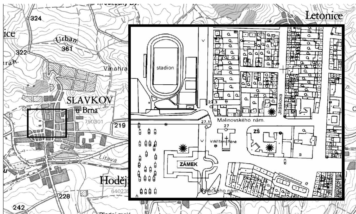
Fig. 2. The winter roosting places of Long-eared Owls in Slavkov u Brna in the winters 1979/80-2006/07

Přesuny zimních shromaždišť kalousů ve Slavkově mají asi tyto důvody: